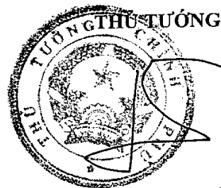
Nguyễn Tấn Dũng